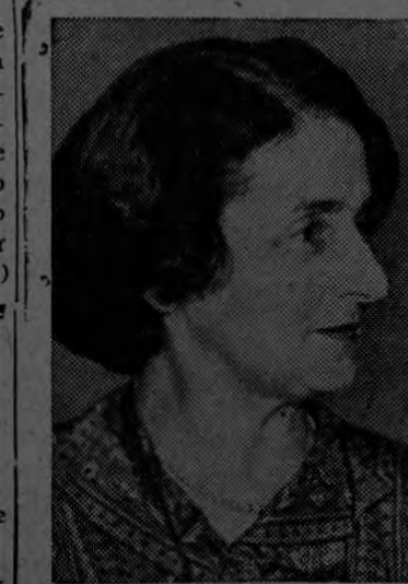
Sra. TONI SENDER

Consultora para la Federación Americana de Trabajo, ante el Consejo Económico y Social de las Naciones Unidas.