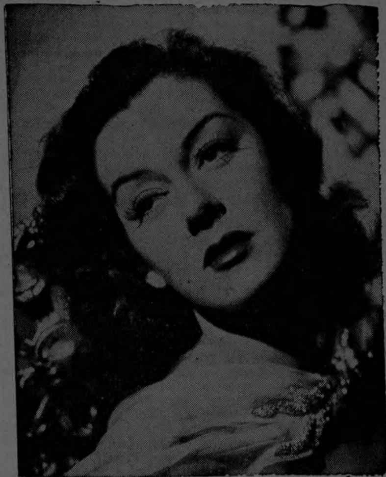
ROSALIND RUSSEL , presenta belleza reporta Max Factor, lo mismo en sus actividades profesionales que en su vida social.

Cuando una mujer está bien y sin la menor preocupación, su apariencia personal, lo revela así hasta en los menores detalles. El vestido, el maquillaje, el peinado, ¡todo!