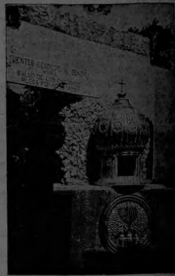
La Virgen de los Angeles